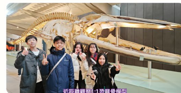
近距離觀察1:1恐龍骨模型