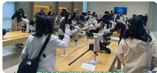
寧波永新光學股份有限公司考察