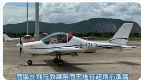
同學在飛行教練陪同下進行起飛前準備Run-up check