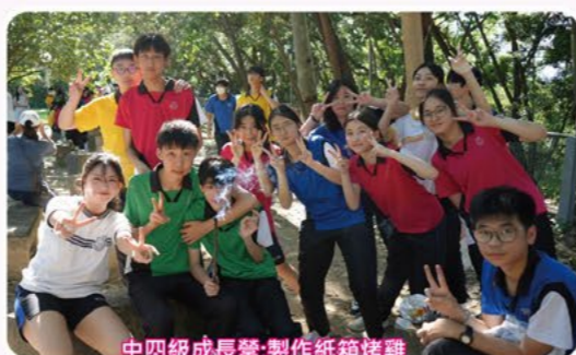
中四級成長營:製作紙箱烤雞