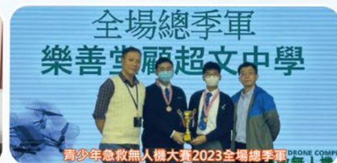
青少年急救無人機大賽2023全場總季軍