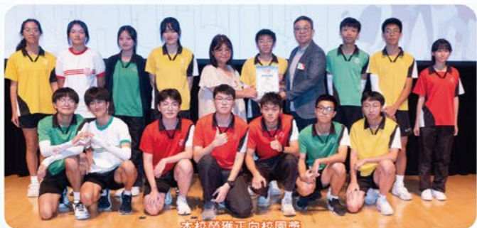
本校榮獲正向校園獎