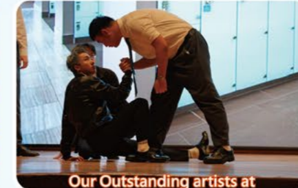
Our Outstanding artists at the Hong Kong School Drama Festival 2023/24.