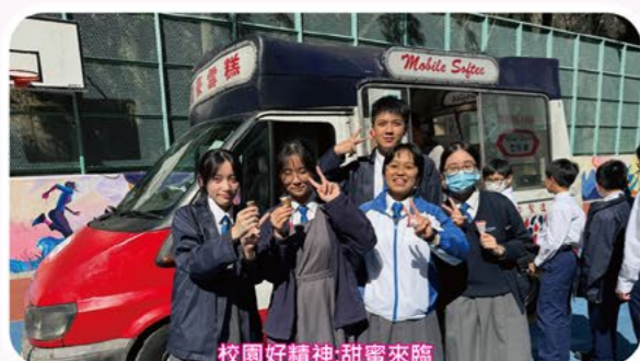
校園好精神:甜蜜來臨