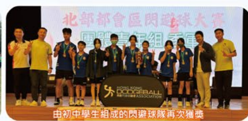
由初中學生組成的閃避球隊再次獲獎