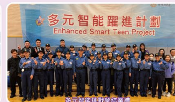
多元智能挑戰營結業禮