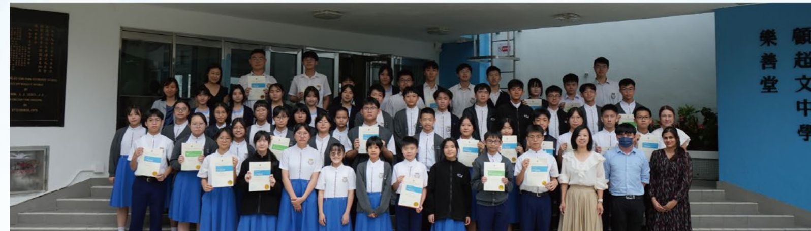
Remarkable Performers in 75th Hong Kong Speech Festival (English)