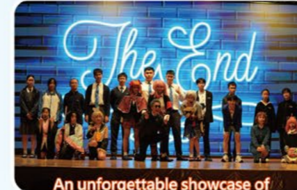
An unforgettable showcase of talents at our drama show.