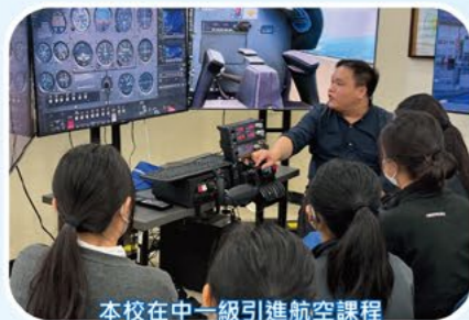
本校在中一級引進航空課程

顧中是全港少數於校內設有航空訓練課程及航空訓練中心的中學，為著帶領學生翱翔世界，擴闊視野。本校航空訓練課程以及航空訓練中心的設施每年都會進行更新，協同學在飛行之路上不斷進步。由2021年至今，顧中在持牌機師葉副校長的帶領下，先後引入8部定翼機模擬器及1部雙人直升機模擬器，並配合VR眼鏡、G1000 Glass Cockpit器材，讓學生能夠學習駕駛最先進的飛機。