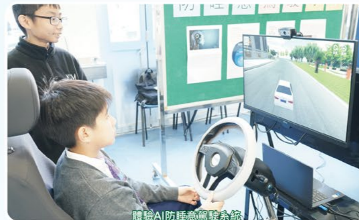
體驗AI防睡意駕駛系統

本校教導學生各種創新科技，並鼓勵他們發揮創意，將科技應用到實際情境中。在AI教育方面，師生合作製作了防睡意駕駛系統，該系統利用AI的臉部辨識功能來檢測司機是否閉上眼睛，並發出警示以避免危險。此外，他們也利用腦電波感應工具製作了腦電波四驅車，並成功透過腦電波感應來控制四驅車的速度。