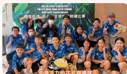
充滿活力的花式跳繩隊

本校的花式跳繩隊成立僅兩年，已於個人及團體組別獲獎無數，當中更有2位隊員入選中國香港代表隊，成績斐然。