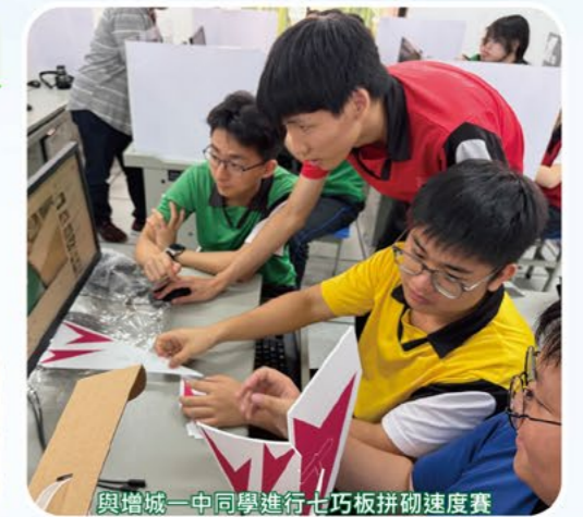
與增城一中同學進行七巧板拼砌速度賽