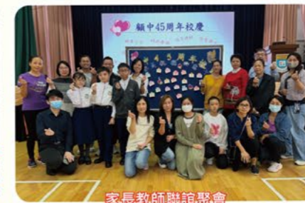
家長教師聯誼聚會