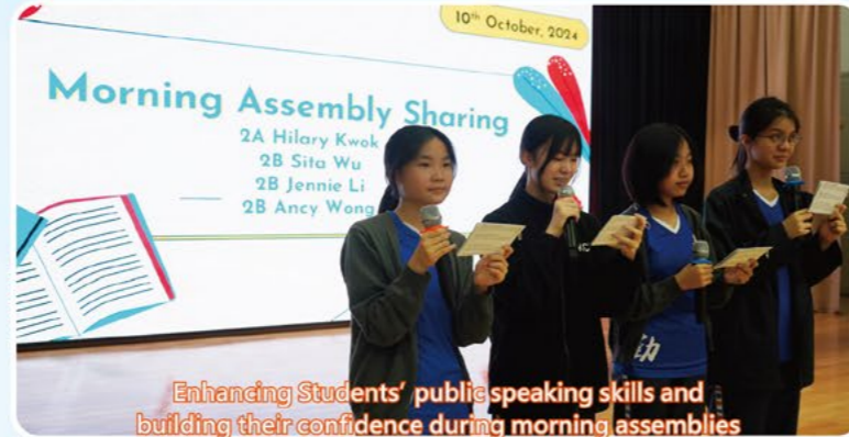
Enhancing Students' public speaking skills and building their confidence during morning assemblies