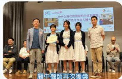
顧中機師再次獲獎

本校派出2支隊伍出戰初階及中階校際模擬飛行挑戰賽，同學於初階比賽中需要起飛、進行五邊飛行並安全降落(Circuit)；而在中階比賽方面，同學需要進行跨國土飛行，並與控制塔以航空專業用語保持溝通。兩支隊伍分別取得初階最佳飛行時間季軍及中階傑出表現獎。