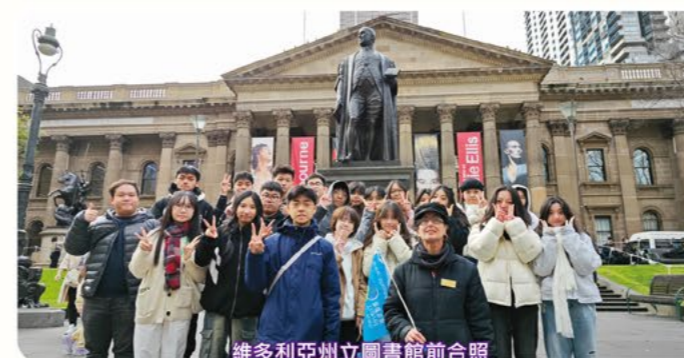
維多利亞州立圖書館前合照