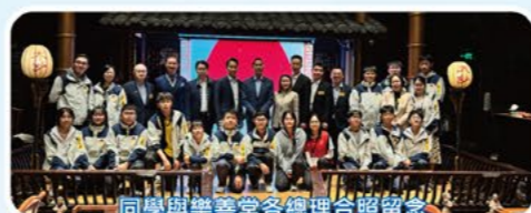
同學與樂善堂各總理合照留念

九龍樂善堂是本校的辦學團體，多年來大力支持本校的發展。除了捐建校舍設施和提供獎學金外，亦不時為遭遇困境的學生家庭提供緊急經濟援助。九龍樂善堂更為學生提供多元化的學習機會，例如全額資助學生參加「青年四川交流團」、「2024蓉港澳青少年活力周」和「粵港澳大灣區暑期實習計劃」，助學生拓展視野，提升綜合能力，促進學生的全人發展。