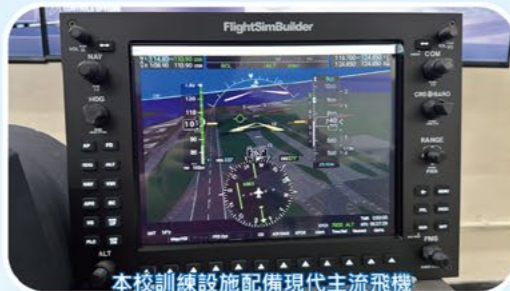
本校訓練設施配備現代主流飛機使用的G1000 Glass Cockpit