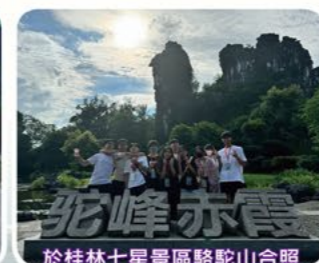
於桂林七星景區駱駝山合照