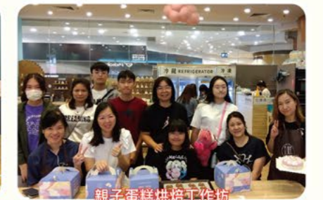
親子蛋糕烘焙工作坊