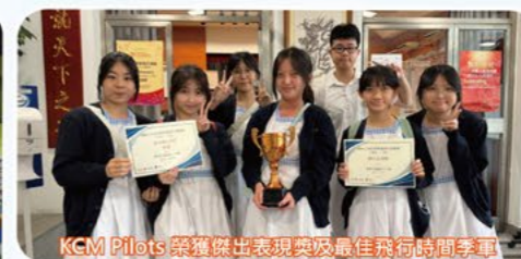
KCM Pilots 榮獲傑出表現獎及最佳飛行時間季軍