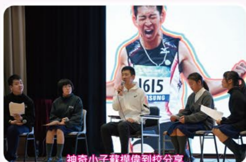
神奇小子蘇禪偉到校分享