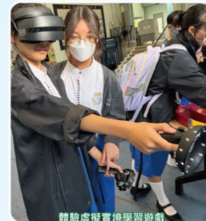
體驗虛擬實境學習遊戲

STEAM week透過各式各樣的學生體驗活動，讓全體學生感受STEAM在日常生活的實際應用。學生可透過AI鏡頭的協助下完成駕駛任務；也能透過VR頭戴式裝置參與引人入勝的故事虛擬體驗。STEAM week使學生整體對STEAM的認識大大提高，並激勵部分學生往後潛心於STEAM相關學科深造及在比賽發展。