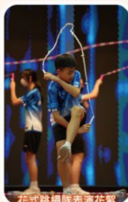
花式跳繩隊表演花絮