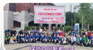
探訪四川新都一中