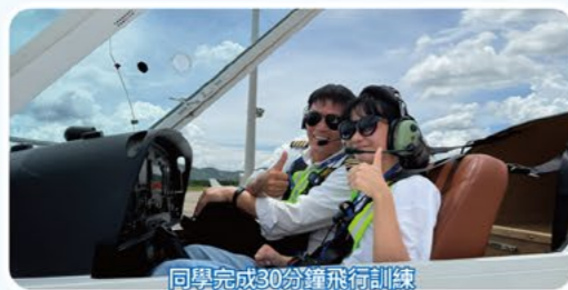
同學完成30分鐘飛行訓練「自信心滿滿」