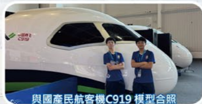
與國產民航空機C919模型合照

顧中學生一行30人參加了由教育局舉辦的「珠海航天航空探索之旅」。透過參觀珠海太空中心、參加科普課程及手工體驗環節，學生們認識到國家在航天及航空科技方面的發展和成就，也培養了他們對創新科技的興趣。