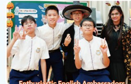
Enthusiastic English Ambassadors with our NET