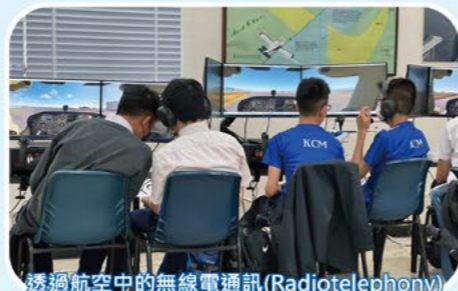
透過航空中的無線電通訊(Radiotelephony)為學生創設運用英語的機會