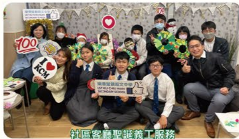
社區客廳聖誕義工服務