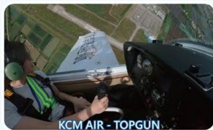
KCM AIR - TOPGUN

2024年7月，本校5位學生於珠海蓮州通用機場在飛行教練陪同下駕駛定翼機SA 60L Aurora進行真機飛行訓練。同學首次可以衝上雲霄，感到十分興奮。在30分鐘的飛行訓練中，他們完成多個基本飛行動作例如起飛、水平轉向、爬升、下降以及降落，經驗難忘。