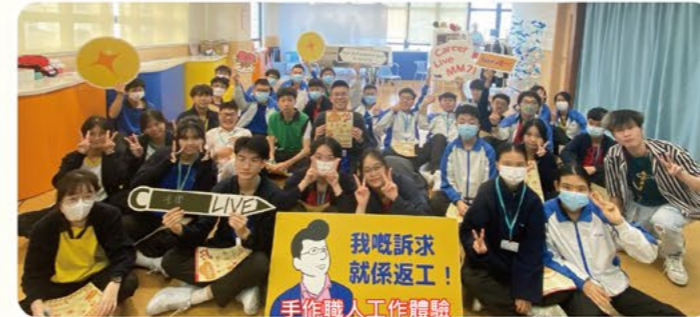
手作職人工作體驗

生涯規劃組致力為中一至中六級學生推行生涯規劃教育，並提供升學輔導支援，籌辦各種活動，例如講座和工作體驗，以幫助學生深入了解自己的興趣、能力和事業願景。透過豐富的學習經驗和工作世界的認識，協助學生找到理想的學業或就業途徑。