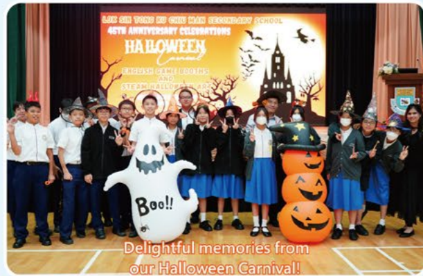
Delightful memories from our Halloween Carnival!

Beyond classroom learning, we encourage participation in various public competitions, such as verse speaking competitions organized by the Hong Kong Schools Music and Speech Association and the Hong Kong Education Development Association. The results have been encouraging, and students have gained valuable experiences through these competitions.