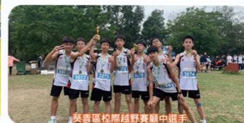
葵青區校際越野賽副中選手