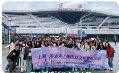
寧波高鐵站前全團合照

本校參加了「同行萬里」考察團，為學生提供不同的學習經歷，加深他們對祖國的歷史、文化、科技及經濟發展等各方面的認識，提升國民身份認同。