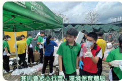
賽馬會眾心行善·環境保育體驗