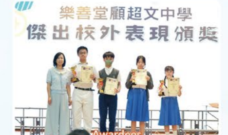
Awardees in different Solo Verse Competitions