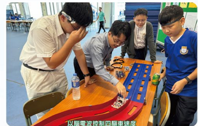
以腦電波控制四驅車速度