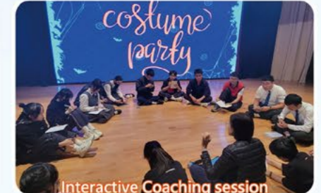
Interactive Coaching session