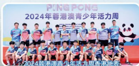
2024蓉港澳青少年活力周香港代表