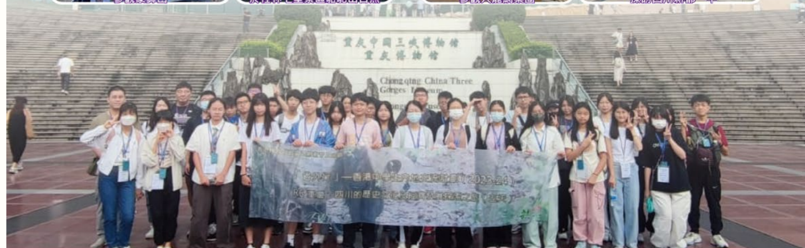
「海外研」—香港中學聯合會2023/24年度交流團「重慶、四川的歷史文化及經濟發展探索之旅」合照