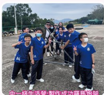
中一級生活營:製作成功羅馬炮架