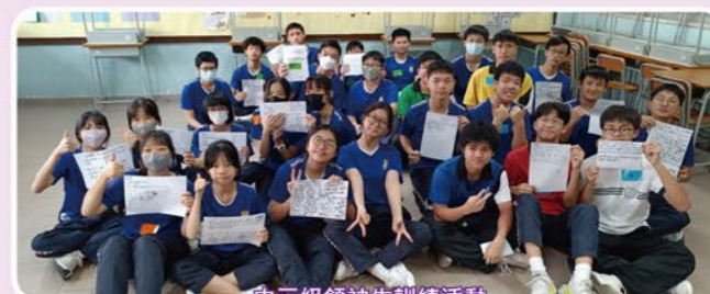
中三級領袖生訓練活動

領袖生是本校重要的學生領袖團隊，由中二至中五級的學生組成，全校共約一百人。本校期望透過建立具規模的領袖生團隊，培養學生的自信心、責任感、勇於承擔及守規自律的精神。為了讓學生嘗試不一樣的學習經驗，本校20名初中學生參加了香港消防多元智能挑戰營，進行留宿訓練，培養學生紀律及領導等才能。