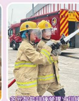
多元智能訓練營撲火訓練

本校透過學生會和四社的活動，致力培養學生成為卓越的領袖。我們鼓勵同學自主籌辦各類活動，並在過程中提升策劃、組織與溝通協調等能力。每學年的社員大會、社幹事交接營及中一迎新日等，不僅增強了各社的凝聚力，還提升了同學們的歸屬感。學生會也積極提供各項服務和籌辦活動，如聖誕嘉年華及閃避球比賽，讓幹事團隊在當中展現服務精神。本校的制服團隊包括空童軍、女童軍和紅十字會青年團，各隊均提供不同的活動、技能培訓和社會服務體驗，為學生建立紀律、責任和團隊合作精神，使他們成為良好公民，服務他人。