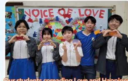
Our students spreading Love and Happiness

Our English department team was instrumental in this success, tirelessly training students and providing them with invaluable support. Their commitment to refining performances and instilling confidence was evident throughout the preparation process. The teachers also contributed to training students for solo verse performances, ensuring they were well-prepared and confident. The encouragement and expertise offered by the entire team helped students shine on stage. Solo verse participants excelled, earning numerous awards that showcased their talent and dedication. These achievements not only highlight the students' hard work but also inspire others to strive for excellence in their own endeavors.