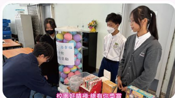
校園好精神:總有你獎賞