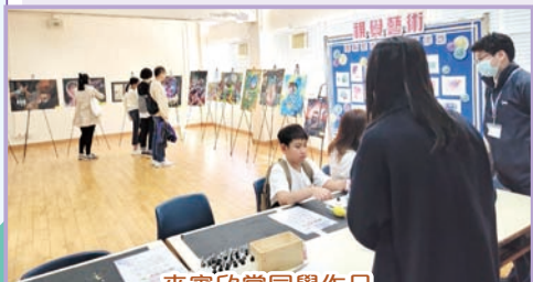
來賓欣賞同學作品

來賓對同學的佳作讚譽有加。在欣賞本科藝術作品的同時，亦能在同學的協助下創作出既繽紛又驚喜的酒精墨水畫作，充分體驗藝術創作的樂趣。