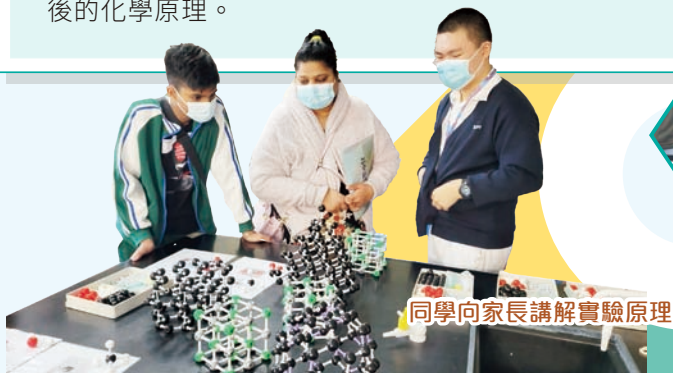
同學向家長講解實驗原理