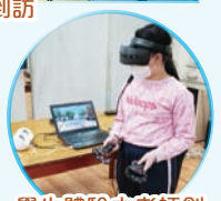
學生體驗由老師創作的VR學習遊戲