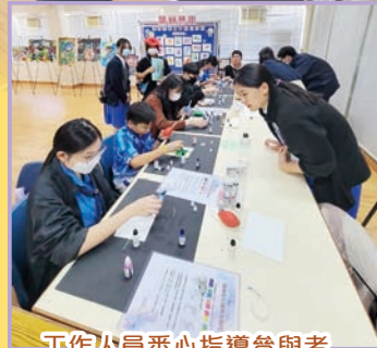
工作火員悉心指導參與者