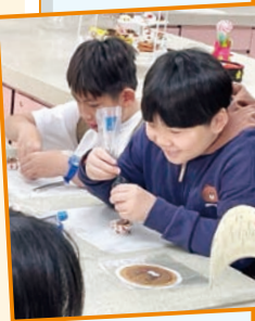
來賓用心製作迷你撻