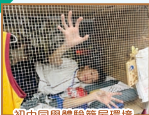
初中同學體驗籠屋環境