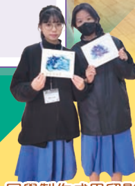
同學製作成果留影