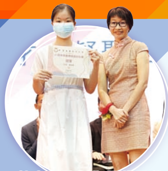
校慶口號創作得獎同學

為慶祝創校 45 周年，讓同學發揮創意，中文科主辦了校慶口號比賽，而視藝科亦舉辦了標誌及吉祥物創作比賽。得獎作品各有特色，展現顧中精神。