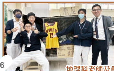
地理科老師及負責同學合照

在眾多的城市問題中，房屋短缺是香港社會一直熱切關注的社會問題。根據統計，現時全港有超過 11 萬戶基層家庭、逾 22.6 萬人住在籠屋或劏房。透過活動模擬籠屋活動，希望讓來賓設身處地思考及關注香港的房屋問題，並思考解決問題的方案。