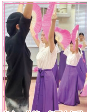
台上一分鐘，台下十年功

適逢 45 周年校慶，中國舞學會特意獻上《桔梗花》舞蹈表演。桔梗花的花語是永恆的愛，代表全體師生對顧中的愛。優美典雅的舞姿時而抒情、時而奔放，如同顧中學子剛柔並重、溫婉又熱情的鮮明性格。白鶴吉祥純潔，在歌舞藝術中模仿鶴的步態起舞，並在“鶴步柳手”的步態中，以動靜結合為特點，以內在之動帶起外在之動，動中有靜，動起來又鬆弛自如，瀟灑流暢，靜下來婀娜多姿，儀態萬千，有如桔梗花朵含苞待放。