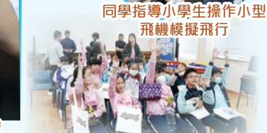
浸信會聯會小學的學生在活動中表現雀躍