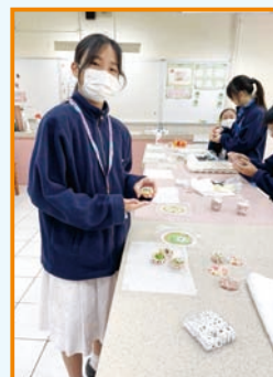
學生工作人員參與製作