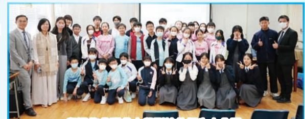
與浸信會聯會小學到訪的師生大合照