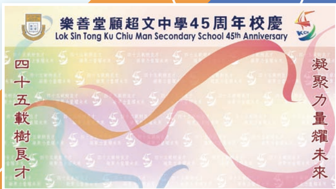
配合口號及標誌製作的電子簽名板