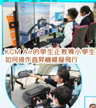
KCM Air的學生正教導小學生如何操作直昇機模擬飛行