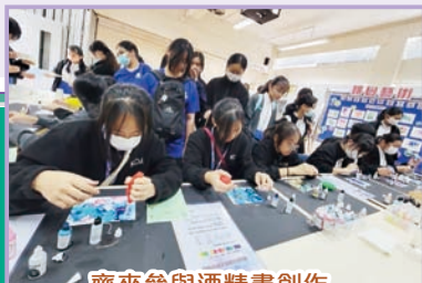
齊來參與酒精畫創作