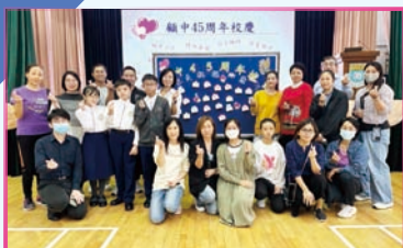
家長教師聯誼聚會