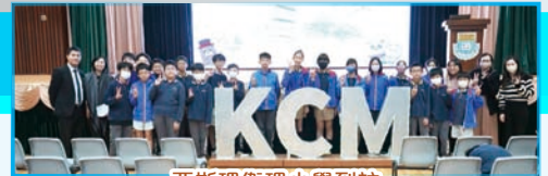
亞斯理衛理小學到訪

適逢本校 45 周年校慶，邀請了區內小學蒞臨參觀，讓小學師生更瞭解本校的學習情況。在 2023 年 12 月 6 日及 12 月 8 日，分別有亞斯理衛理小學及浸信會聯會小學到訪，進行 STEAM 體驗活動，包括人工智能監控駕駛者狀態的防睡意駕駛系統、腦電波四驅車、模擬飛行、無人機足球、人體彩繪和由老師及學生自行創作的 VR 教學遊戲。經本校同學悉心指導，小學生非常投入活動，更學習了各種科技原理的相關知識。