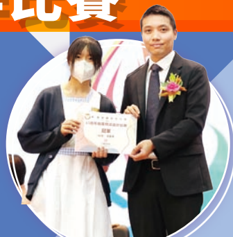
校慶標誌創作得獎同學