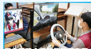
學生體驗人工智能如何應用於協助司機安全駕駛