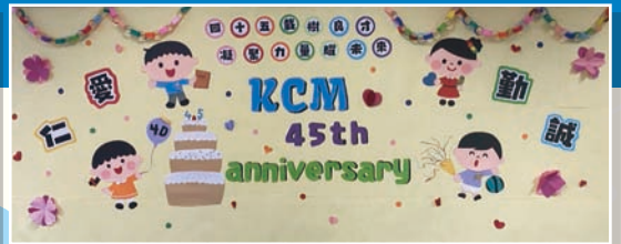
45周年校慶壁報設計比賽得獎作品