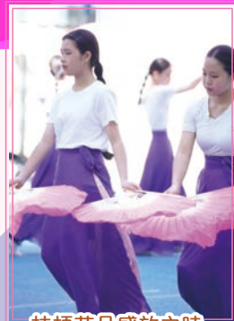
桔梗花朵盛放之時