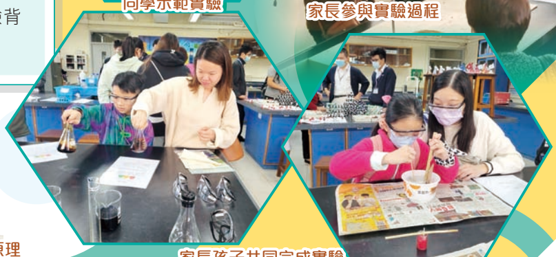
家長孩子共同完成實驗