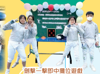
劍擊一擊即中攤位遊戲