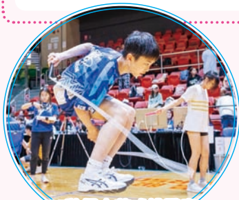
45秒個人花式挑戰賽