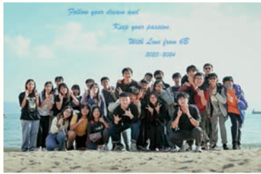
45周年創意班相比賽得獎作品