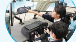
同學指導小學生操作小型飛機模擬飛行