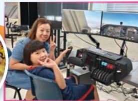
內地航空發展初探及家長飛行體驗工作坊