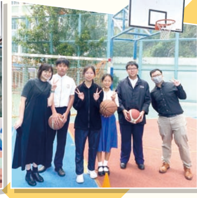
45周年班際投籃比賽