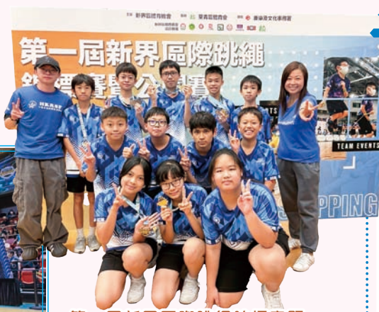
第一屆新界區際跳繩錦標賽暨公開賽教練及得獎隊員合照