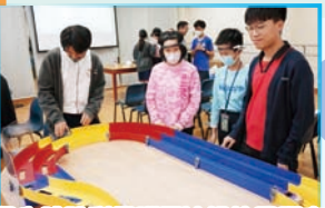
學生體驗利用腦電波操控四驅車