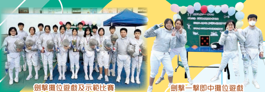
劍擊攤位遊戲及示範比賽